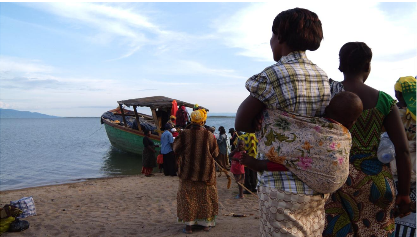
Réfugiés congolais s'apprêtant à traverser le Lac Tanganyika pour rentrer en Tanzanie après une visite de préparation au retour dans leur village d'origine (Baraka).